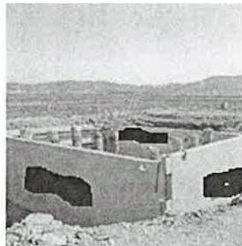
Figuras meramente ilustrativas